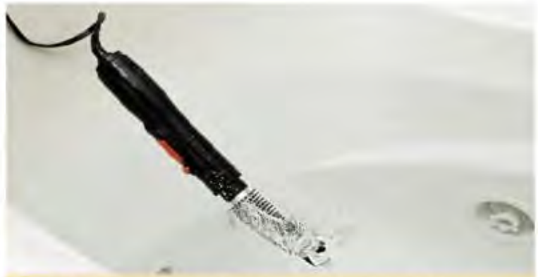
b La salle de bains présente des risques car c'est l'endroit le plus humide du domicile. L'eau du robinet conduit aussi l'électricité. Par précaution, ne jamais laisser un appareil électrique branché dans la salle de bain.