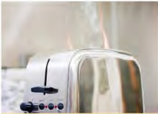
a La cuisine peut être l'endroit le plus dangereux du domicile. Par précaution, débrancher tout appareil électrique après utilisation.