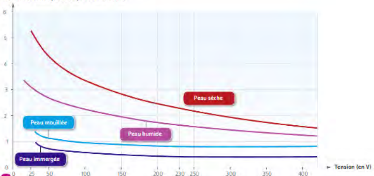
Résistance électrique du corps humain (en k\Omega )