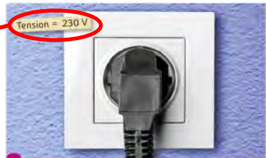
3 La tension du secteur. C'est la tension disponible aux bornes d'une prise de courant. Elle permet de faire fonctionner les appareils électriques usuels.

4- Le disjoncteur protège l'installation électrique : il coupe automatiquement le courant dès que l'intensité dépasse 30 \text{ mA} (0,03 \text{ A}) , ou en cas de défaut dangereux, afin d'éviter les risques d'électrocution.